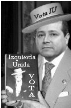
La campaña de IU