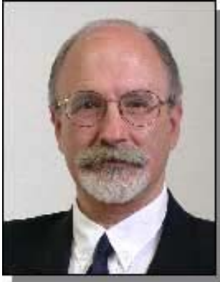
El de IU