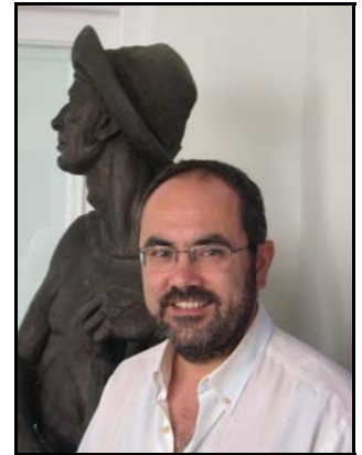
Er shavá que lleva lo de cronista