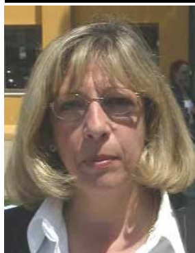
Ella en si misma

Sábado 22 de Octubre de 2005 a las 12 de la noche